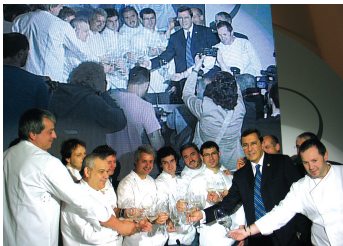
Los trece chefs firmantes del acuerdo con el diputado general, José Luis Bilbao

Y es que, aunque ya se 'vendía' la gastronomía vizcaína en la totalidad de las actividades de impulso del turismo, a través de este convenio los restaurantes que lo suscriben se comprometen a poner a disposición de la Dirección General de Turismo de la Diputación de Bizkaia una, o varias mesas, para un máximo de doce comensales al año, con el objeto de que sean ocupadas por el Ente foral, con doce comensales que considere de interés estratégico contrastado. Como ya se indicaba, el acuerdo tiene carácter abierto y el objetivo de sumar colaboraciones hasta conseguir que todo el sector gastronómico y de restauración de